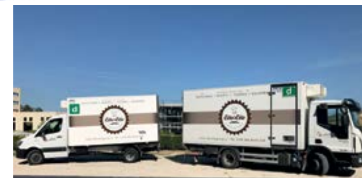
ELLE&amp;ELLE SERVE LE AREE DE L'AQUILA, TERAMO, PESCARA E CHIETI

più salutari. Noi ci sentiamo pronti e in linea con queste nuove tendenze del mercato per poter supportare a 360 gradi i nostri clienti.