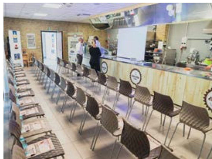
L'ACCADEMIA ELLE&amp;ELLE CHE OSPITA CORSI DI FORMAZIONE E SHOWCOOKING